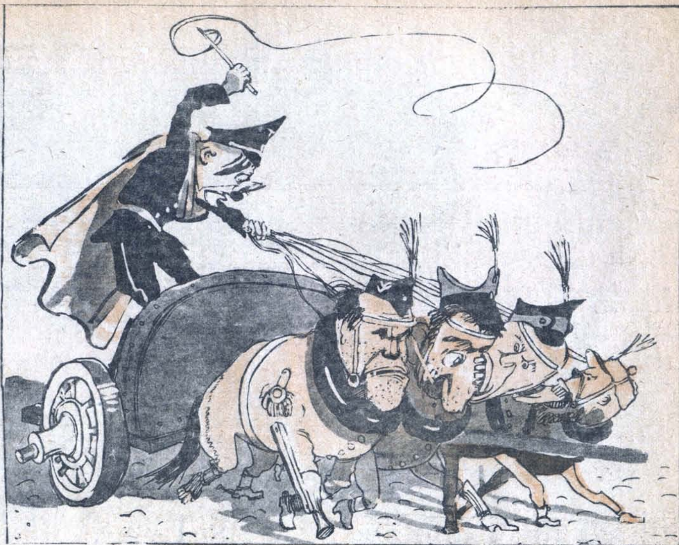
Рис. А. Каневского