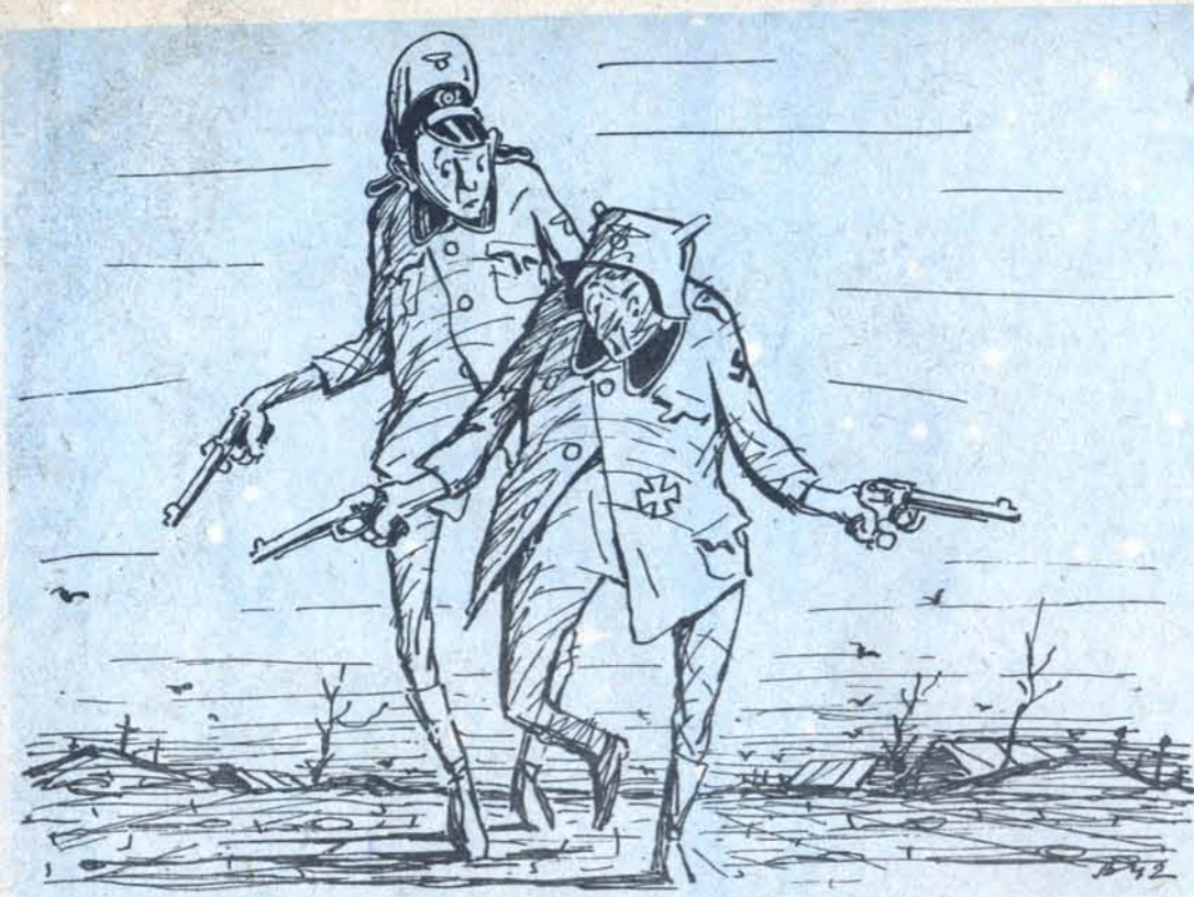
Рис. Г. Валька