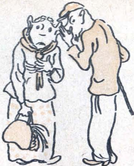
— Рассказал один солидный человек... Не трепач...