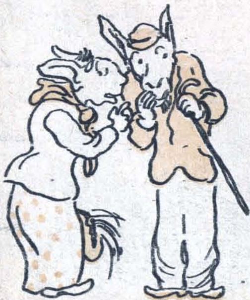
— Вот так новость!..