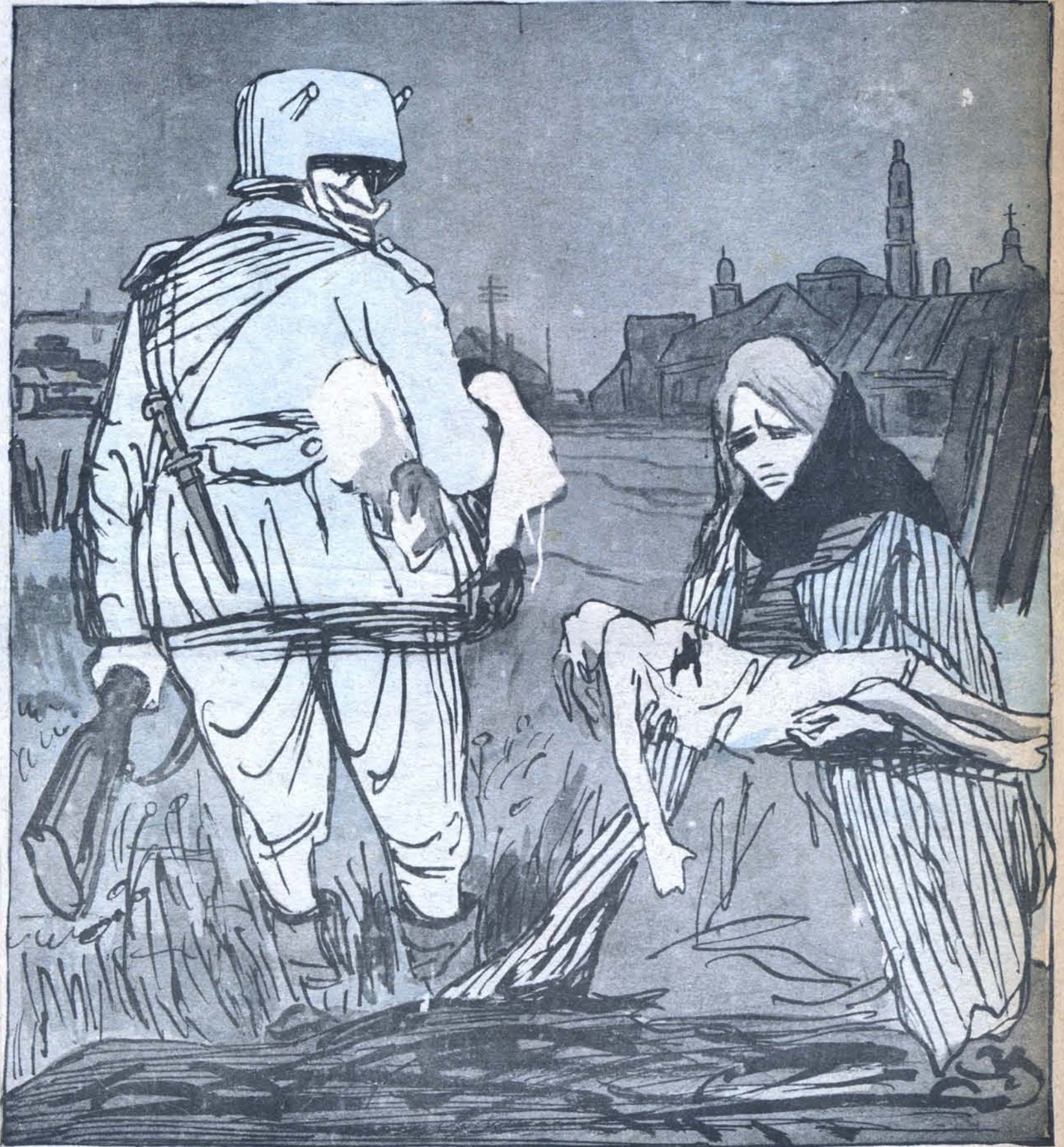
Рис. Л. Бродаты

— Кто скажет, что я плохо отношусь к детям! Вот одежонку с твоего мальчишки я и беру для моего Ганса.