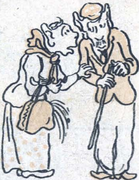
— Да что вы говорите?..