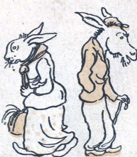
— Пойти рассказать...