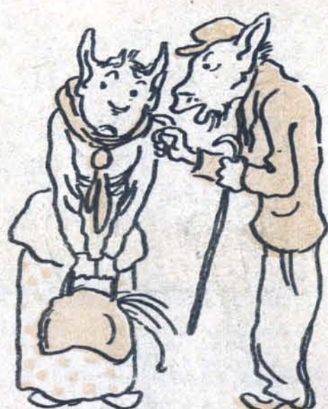
— Уверю вас!.. Это точно!..