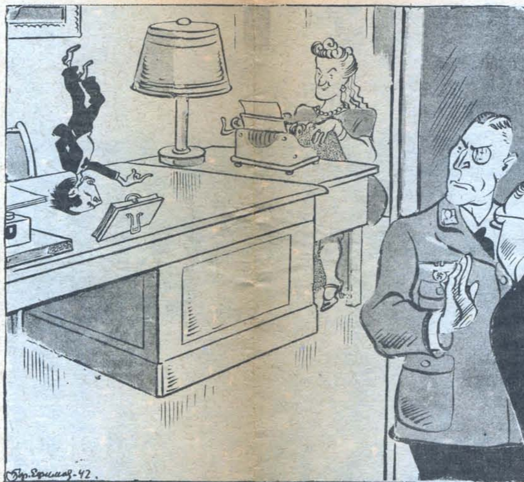
Бор. Ефимов. 42.

— Что это с господином Геббельсом? — Диктует очередную информацию. Так ему легче придумывать все наоборот.